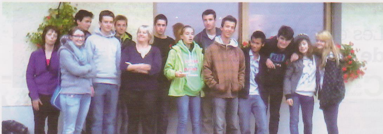
▲ Le groupe des lycéens.

Une année d'aumônerie pour apprendre à résister